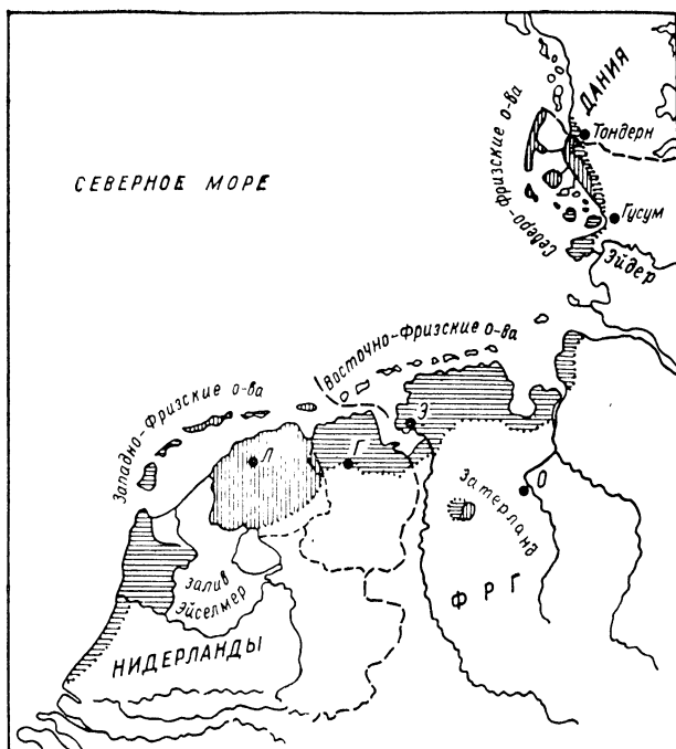
Карта-схема 1. Распространение фризского языка.